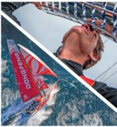
Dongfeng Race Team grand vainqueur de la Volvo Ocean Race 2017-18